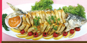
イナダのワンタン巻き揚げ

鶏もも肉をロール状に巻きフイヨンで高く上げ、リング状にしたポテトサラダの中に盛り付けました。スパイスソースでお召し上がりください。