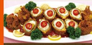
海老コロッケ磯辺揚げチリソース

鶏胸肉をボイルしてカット、はちみつ・マスタード・マヨネーズのソースで和えました。パン(フォカッチャ)に挟んでお召し上がりください。