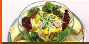
チキンのハニーマスタード

鶏胸肉をボイルしてカット、はちみつ・マスタード・マヨネーズのソースで和えました。パン(フォカッチャ)に挟んでお召し上がりください。