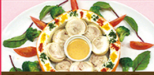
チキンロールのセルクル仕立て

鶏もも肉をロール状に巻きフイヨンで高く上げ、リング状にしたポテトサラダの中に盛り付けました。スパイスソースでお召し上がりください。