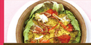
渡り蟹のおこわセイロ蒸し

イナダを3枚におろし、骨は唐揚げ、身は5cm位の棒状にカット。生姜・レモンの皮を千切りしてワンタンの皮で巻き油で揚げました。